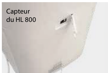
Capteur du HL 800