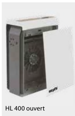
HL 400 ouvert