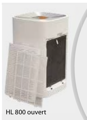
HL 800 ouvert