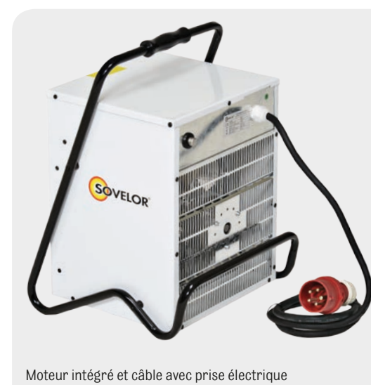
Moteur intégré et câble avec prise électrique