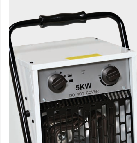
Thermostat d'ambiance et selecteur de fonctions