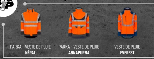
PARKA - VESTE DE PLUIE NÉPAL