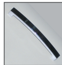
Poignée Métal Chromé Brillant