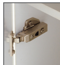
Charnière clipsable avec frein intégré