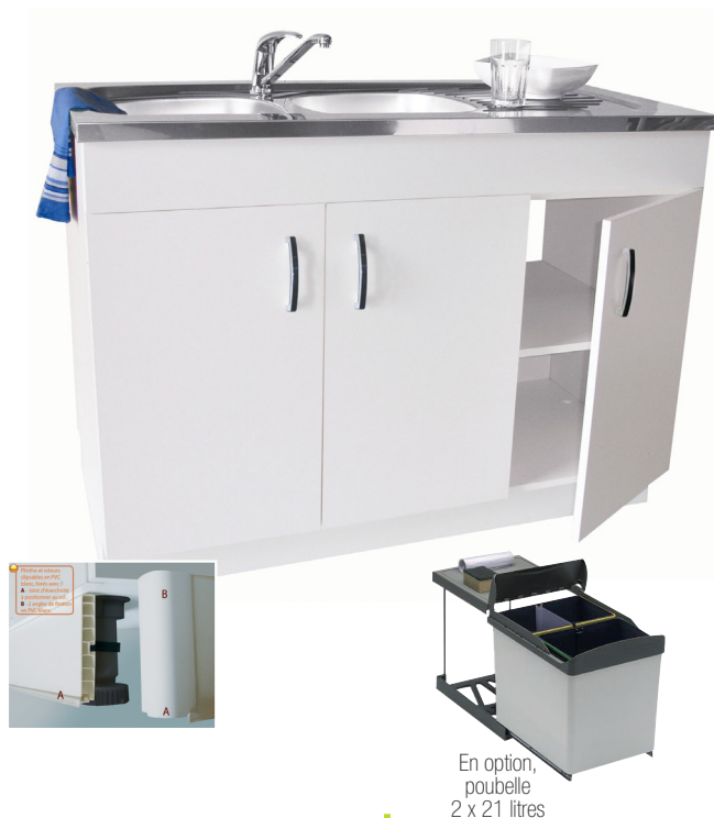
En option, poubelle 2 x 21 litres

Mise à niveau : Pieds ABS avec plinthe clipsable et jeu de retours PVC Blanc avec joints d'étanchéité (livrés dans colis).