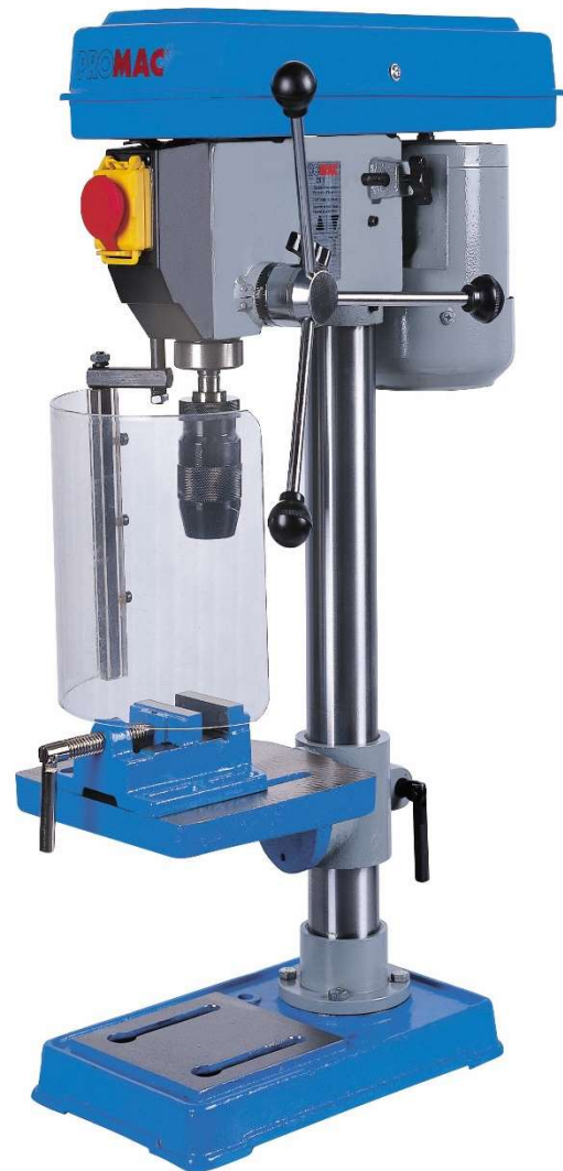
Table de perçage à 2 rainures parallèles de 12mm