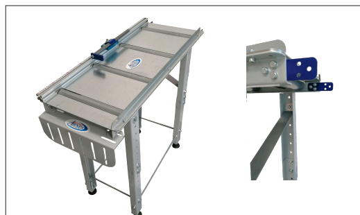
Réf. TFT1M Table entrée ou sortie par 1m