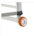
Roues de déplacement Ø 150 mm