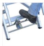
Système de verrouillage de la roue avant