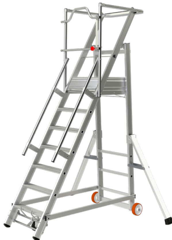
Modèle présenté : 02271107