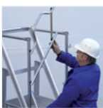
Portillon de sécurité à retour automatique