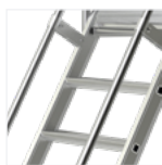
2 rampes d'accès