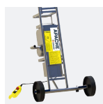
Treuil intégré à l'échelle de base