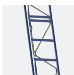
Poutre triangulée en acier galvanisé pour une rigidité maximum et une durabilité accrue