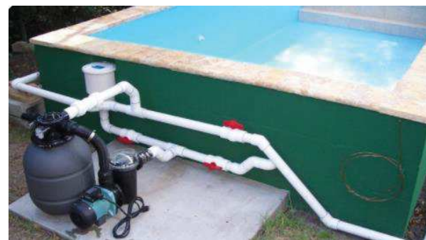
PISCINE Ø 50mm