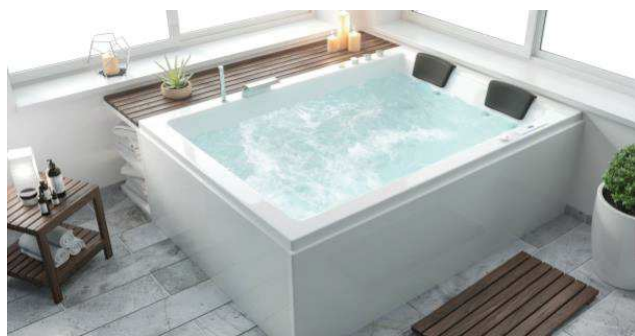
Baignoire / Spa Ø 40 ou 50mm